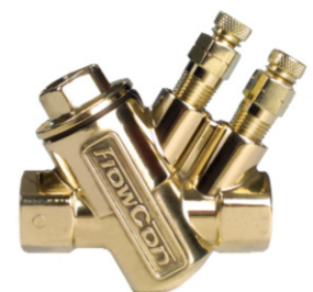
Gehäuse Type AB mit Innengewinde