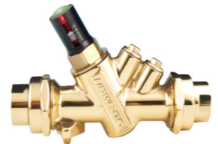
Gehäuse Type ABV mit Außengewinde